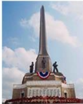
อนุสาวรีย์ชัยสมรภูมิ

โรงพยาบาลเด็ก สถาบันสุขภาพเด็กแห่งชาติมหาราชินี