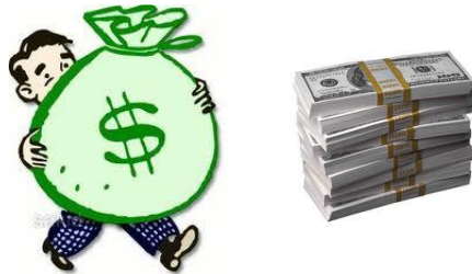
รูปแบบที่ 2: รับก่อนส่วนหนึ่ง ที่เหลือออมต่อ