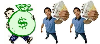
รูปแบบที่ 4: รับก่อนส่วนหนึ่ง ที่เหลือรับเป็น งวดๆ