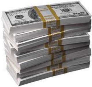
รูปแบบที่ 1: ออมต่อเต็มจำนวน

“ออมต่อ” คือ บริการบริหารเงินสมาชิกโดยการนำไปลงทุนต่อเนื่อง ในแผนสุดท้ายก่อนพ้นสมาชิกภาพ