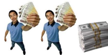
รูปแบบที่ 3: ขอรับเป็นงวดๆ ที่เหลือออมต่อ